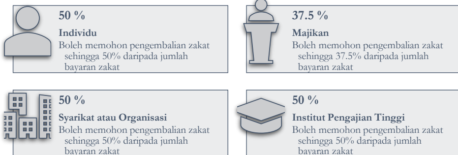
Rajah 2: Ringkasan Kadar Pulangan DWZ MAIWP

Jadual di atas mengenai kadar pulangan yang diberikan kepada pembayar zakat berbeza mengikut kategori entiti dan jumlah zakat yang ditunaikan. Bagi individu yang membayar zakat harta atau pendapatan sebanyak RM20,000 dan ke atas, kadar pulangan yang diberikan bermula dari 12.5% dan boleh mencecah sehingga 50% sekiranya jumlah zakat yang dibayar melebihi RM1 juta. Bagi kategori syarikat atau organisasi yang membayar zakat perniagaan sebanyak RM10,000 dan ke atas, kadar pulangan bermula daripada 37.5% dan boleh meningkat sehingga 50%, selaras dengan jumlah zakat yang dikeluarkan. Dalam konteks pemotongan gaji oleh majikan pula, pulangan wakalah sebanyak 12.5% akan diberikan bagi jumlah potongan zakat melebihi RM100,000, manakala jika potongan gaji melebihi RM100,000 disertai dengan pengesahan bahawa 80% pekerja telah dipotong gajinya untuk zakat, kadar pulangan yang diberikan meningkat kepada 37.5%. Institusi pengajian tinggi juga tidak dikecualikan, di mana mereka diberi kadar pulangan wakalah sehingga 50% tanpa had minimum bayaran zakat. Kadar-kadar ini memperlihatkan insentif kewangan yang ditawarkan bagi menggalakkan penyertaan aktif dalam sistem zakat menerusi mekanisme wakalah .